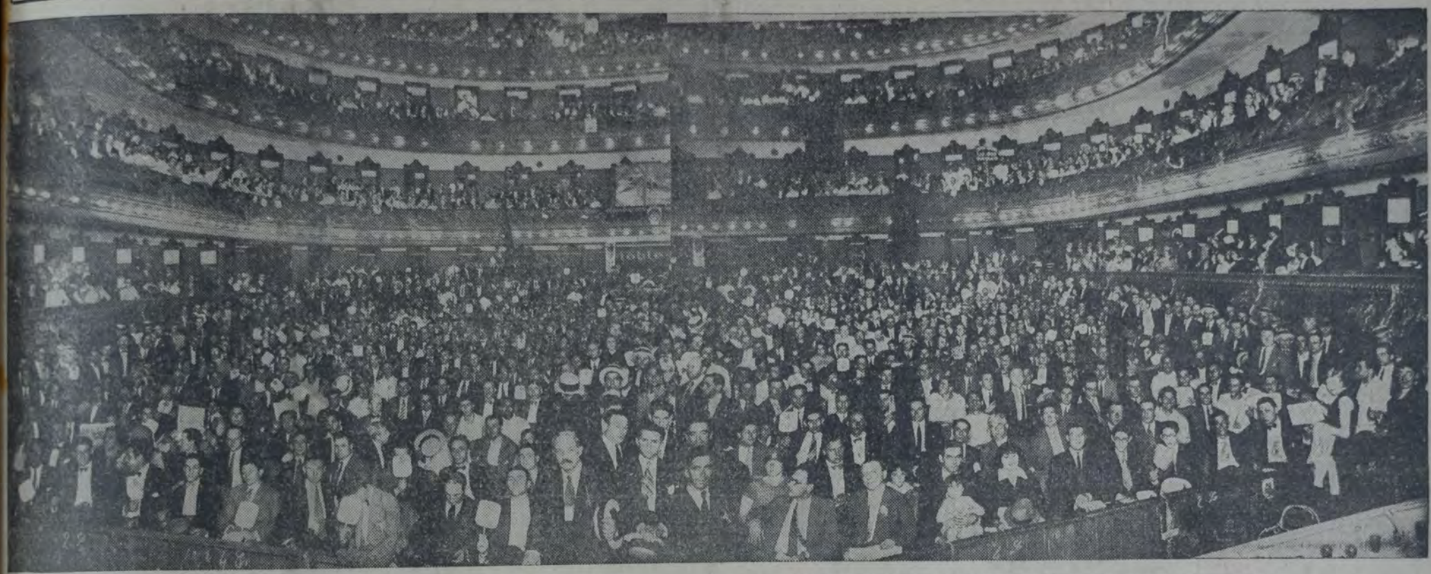
ELOCUENTE FOTOGRAFIA QUE DA UNA IDEA DEL PUBLICO QUE LLENABA ANOCHE LA SALA DEL COLISEO, DURANTE LA PROCLAMACION DE NUESTROS CANDIDATOS.

La amplia sala del Coliseo resultó pequeña para contener los miles de socialistas que exteriorizaron su entusiasmo y su convicción en el triunfo. — En la calle fué necesario levantar nuevas tribunas rodeadas por el público que desbordaba del teatro. — Al finalizar el acto una imponente manifestación marchó detrás de las banderas rojas, hasta la Casa del Pueblo. — Los oradores. — Los coros. — El clarín de la victoria