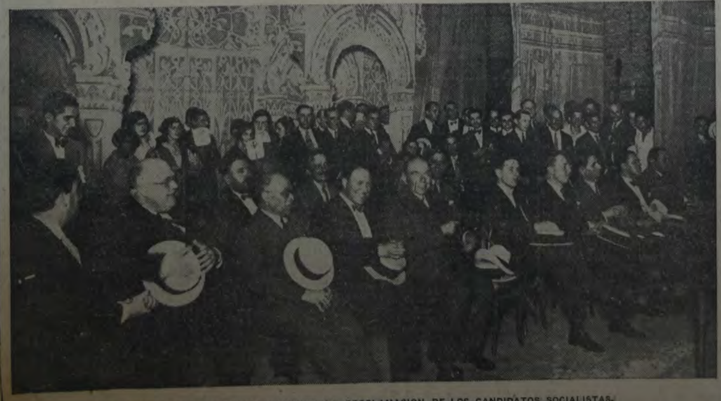
EL ESCENARIO DEL COLISEO, DURANTE LA PROCLAMACION DE LOS CANDIDATOS SOCIALISTAS.

Agotada la capacidad del teatro, habiéndose aprovechado al máximo todo espacio disponible, continuaban llegando incesantemente nuevos grupos que hubieron de ocupar poco a poco la calzada, formando poco después una numerosa y entusiasta asamblea. Millares de ciudadanos reclamaban en estas condiciones se levantara una tribuna en la calle y poco después, accediendo al pedido, se improvisó una en la escalinata del teatro, desde la cual hablaron numerosos oradores, mientras adentro se cumplía el programa. Los oradores se sucedían pronunciando discursos breves y arengas cálidas, las que eran escuchadas y aplaudidas con entusiasmo creciente por la multitud que por espacio de largo tiempo continuó aumentando hasta formar una muchedumbre tan compacta e imponente como la que desbordaba del teatro. A las 23.30 horas la multitud reclamó imperiosamente que se organizara la columna para llevar hasta la Casa del Pueblo, y en ese momento terminando el discurso del doctor Dickmann empezó a dispersarse la sala y formóse la manifestación, que en compacta columna se dirigió hacia la Casa del Pueblo, entonando cánticos obreros y conduciendo grandes banderas rojas.